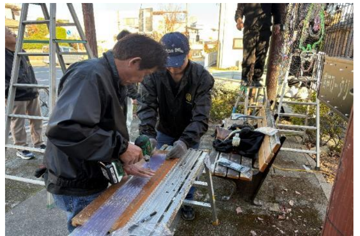
きれいに揃えて・・・