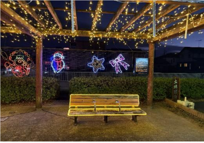
— 懇親会 —