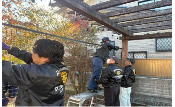
段取りよく設置しています！