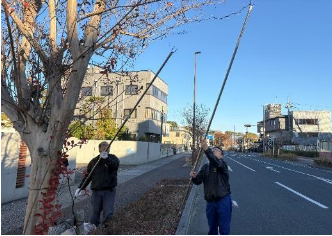
会長も高く高く設置