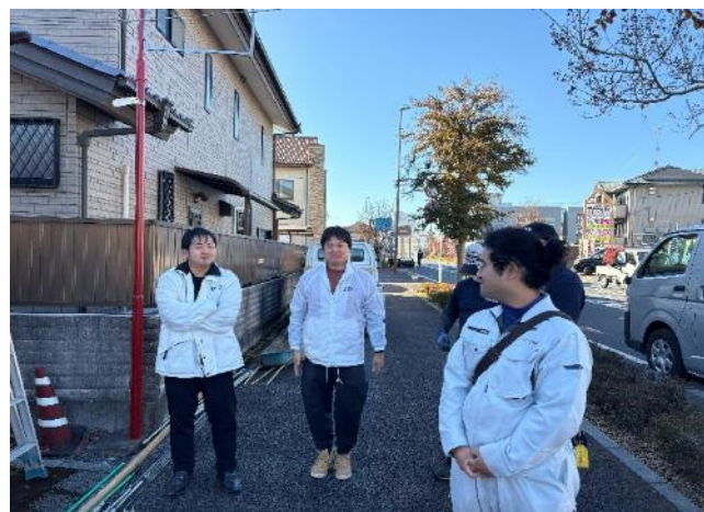
館林青年会議所の皆様