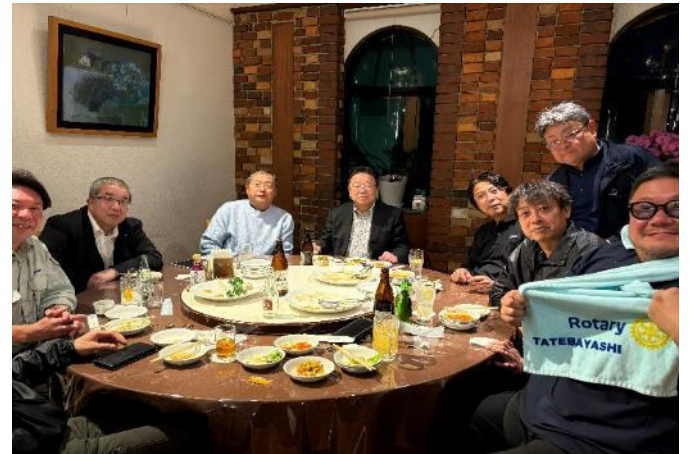
本日はお疲れさまでした！