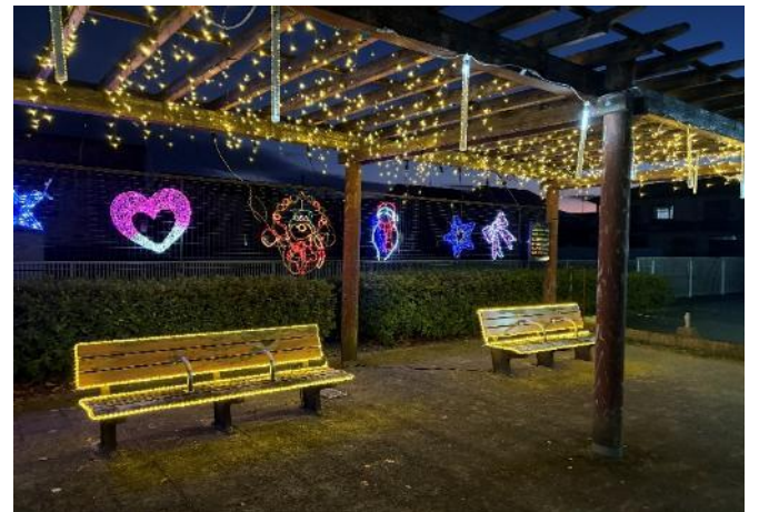
今年もきれいに設置できました！！