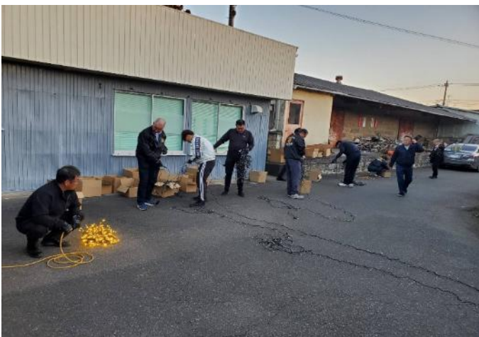
皆さん段取りよく