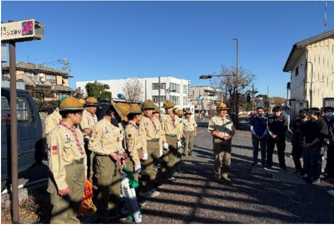
ボーイスカウト館林第1団の皆様