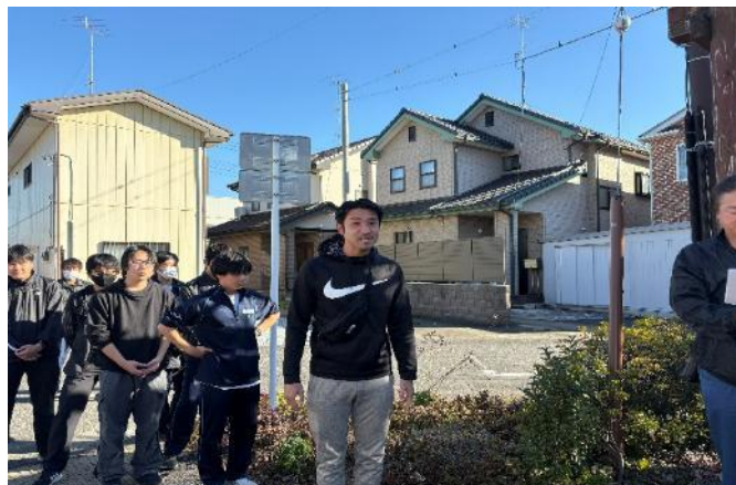
群馬県立館林高等学校の皆様