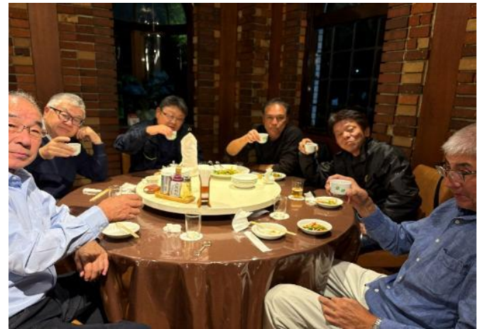
皆さんにこやかに！